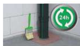
4. שכבת איטום שניה