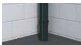
5. שכבת איטום מוגמרת