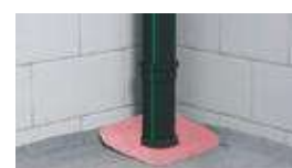
2. התקנה והתאמה למעבר בין קומות