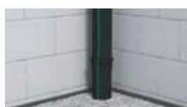
6. שכבת מילוי