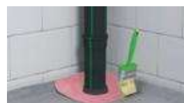
3. שכבת איטום ראשונה