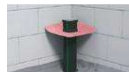
1. התקנה והתאמה למעבר בין קומות