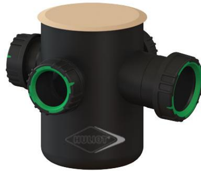
מחסום 140/40/50 פתוח עם שלוש כניסות 40 מ"מ ויציאה 50 מ"מ 70114590